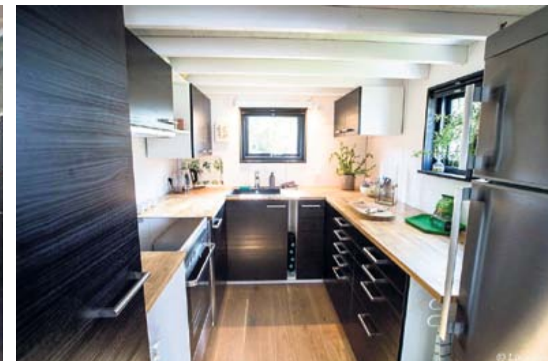
Nogle drømmer om et stort samtalekøkken, andre vil sagtens kunne nøjes med dette fra Tiny House Living.