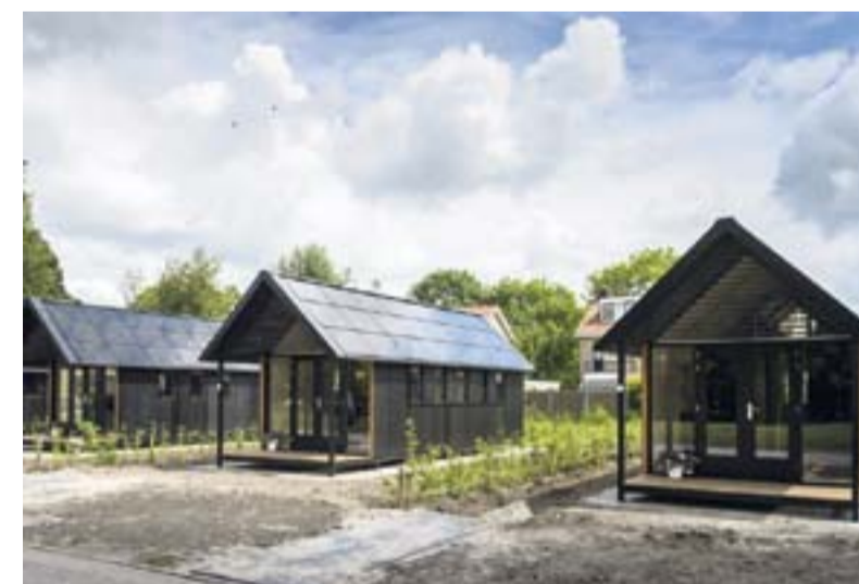
Holland fik tidligere i år sin første vej med små huse, der er 30 kvadratmeter inklusiv terrasse.