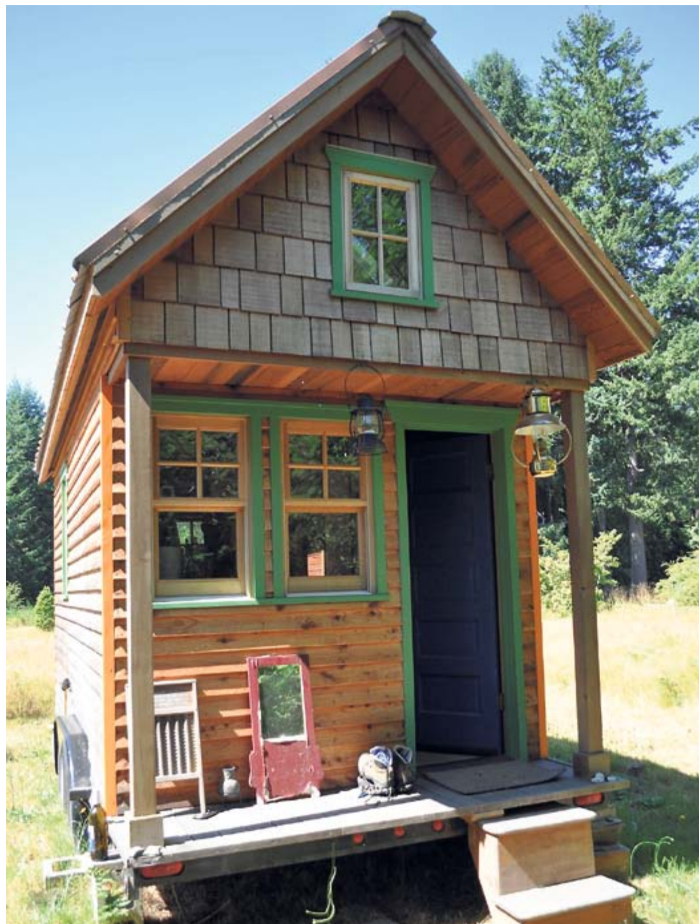
Dette hus står i byen Portland i USA, som er et af de steder, hvor de små huse er blevet særligt populære.

- Har man 200 kvadratmeter, fylder man det op med alt muligt møg. Det gør man ikke her, for det er der ikke plads til. Man får masser